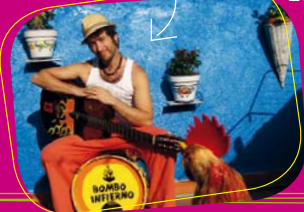
Muchachito Bombo Inferno

C'est un big band de la rue qui transpose toute l'essence chahuteuse et fêtarde de la rumba barcelonaise sur scène. Irrévérencieux et terriblement efficace.